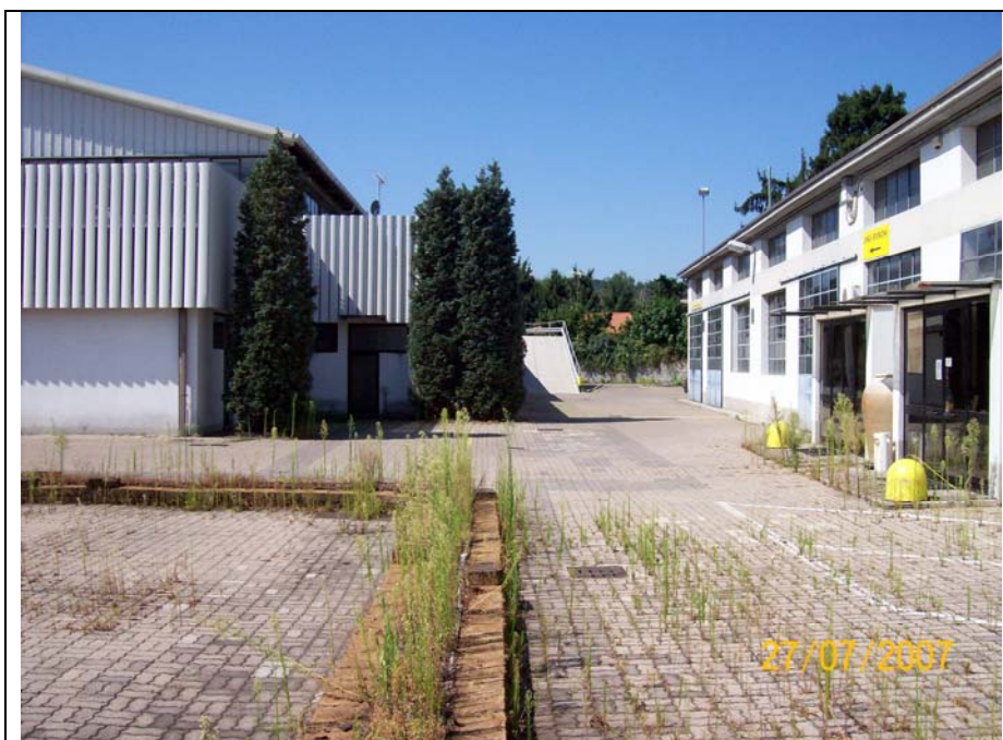
Figura 3 cortile verso manica interna