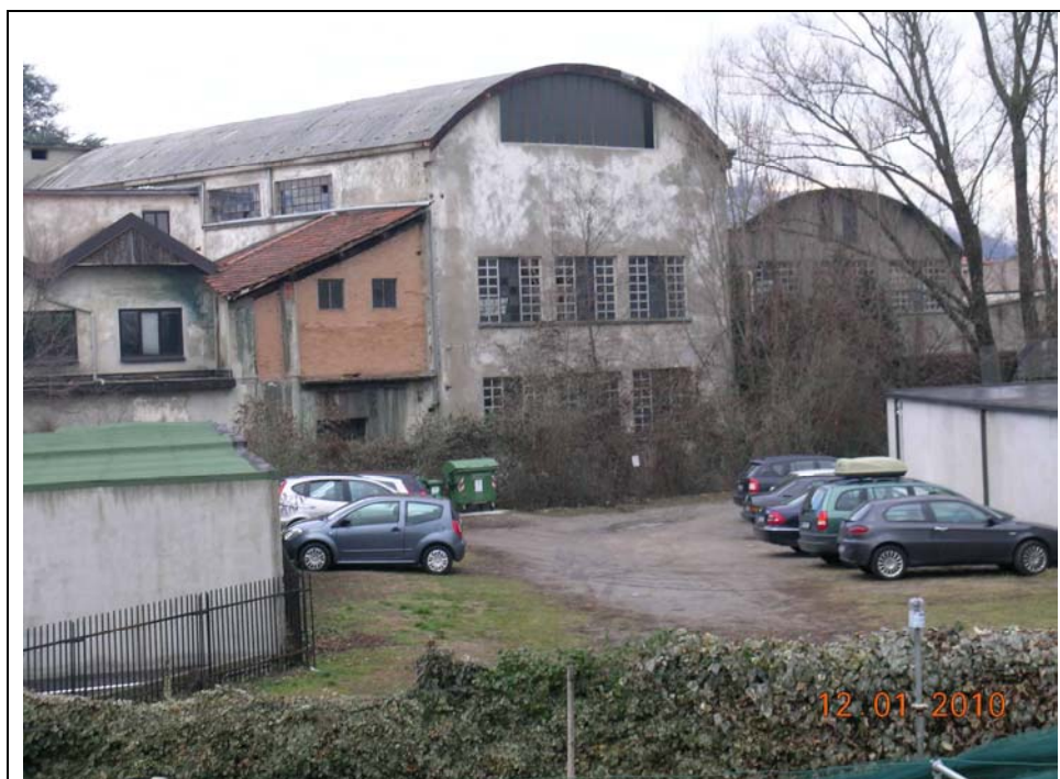
fronte verso Vevera da sponda sx verso fabbricato