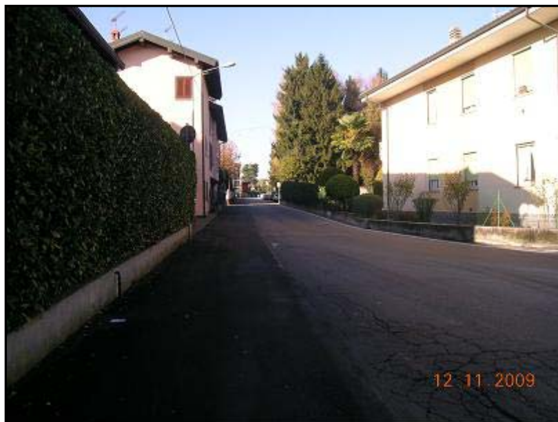
Figura 9 Via 2 Giugno