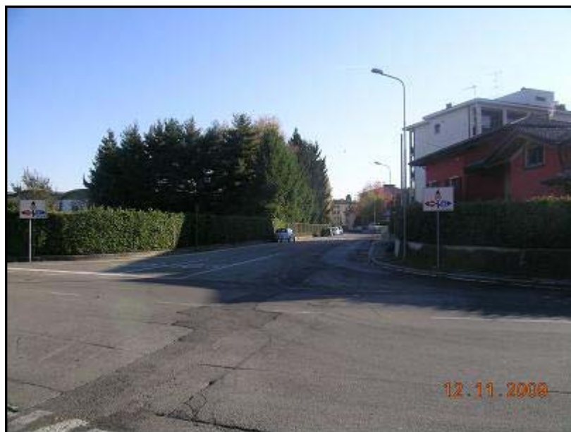
Figura 15 Via General Chinotto