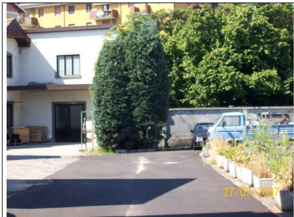
Figura 7 cortile verso ovest manica lungo il Vevera