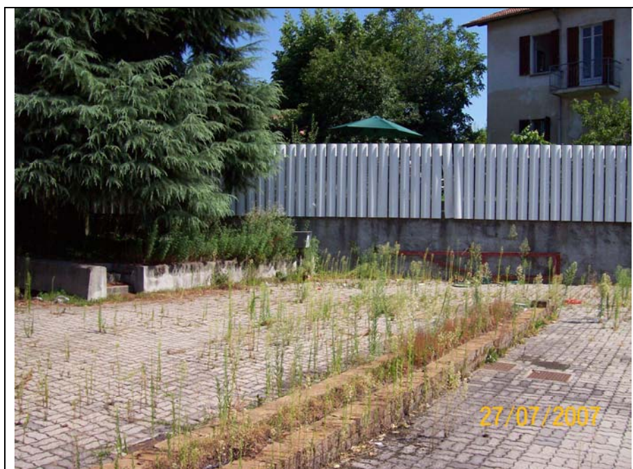
Figura 1- cortile verso Nord