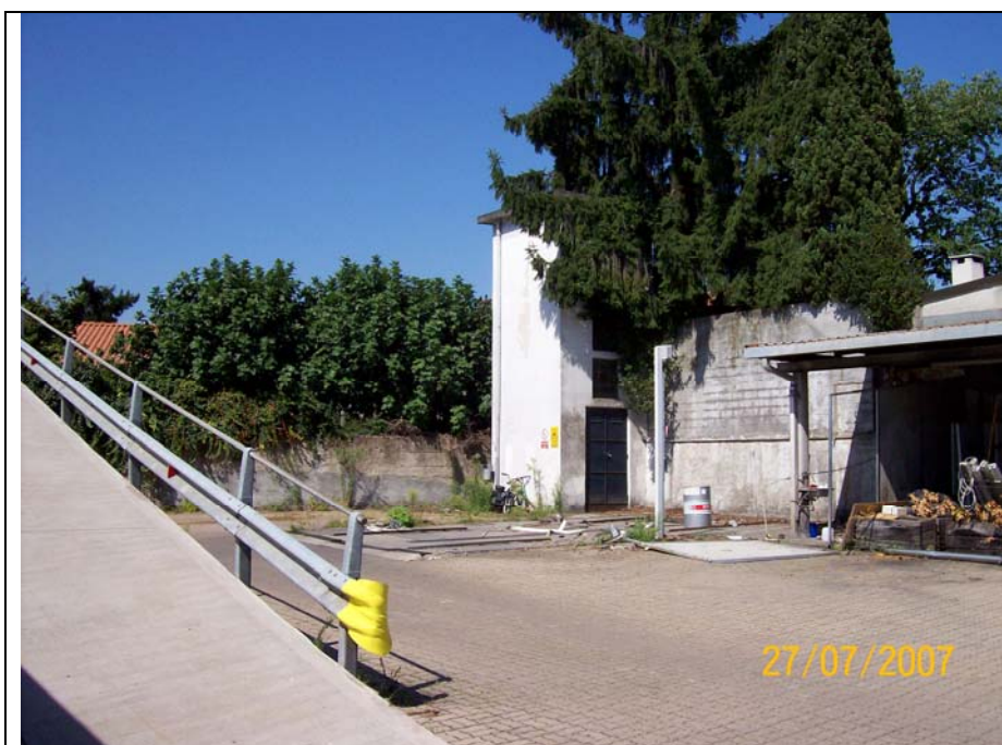
Figura 4 cortile verso ovest-rampa di risalita