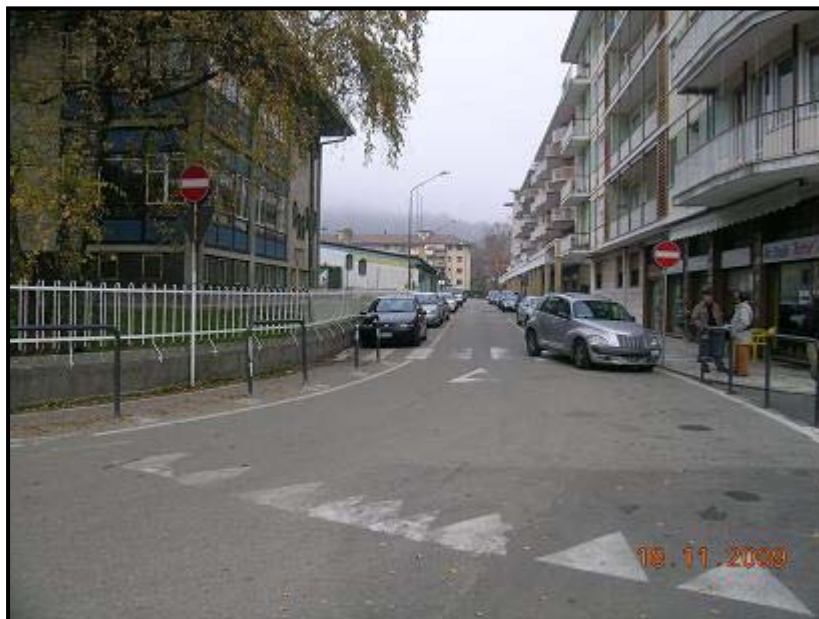
Figura 3 Via Monte Rosa – vista su Via Monte Zeda