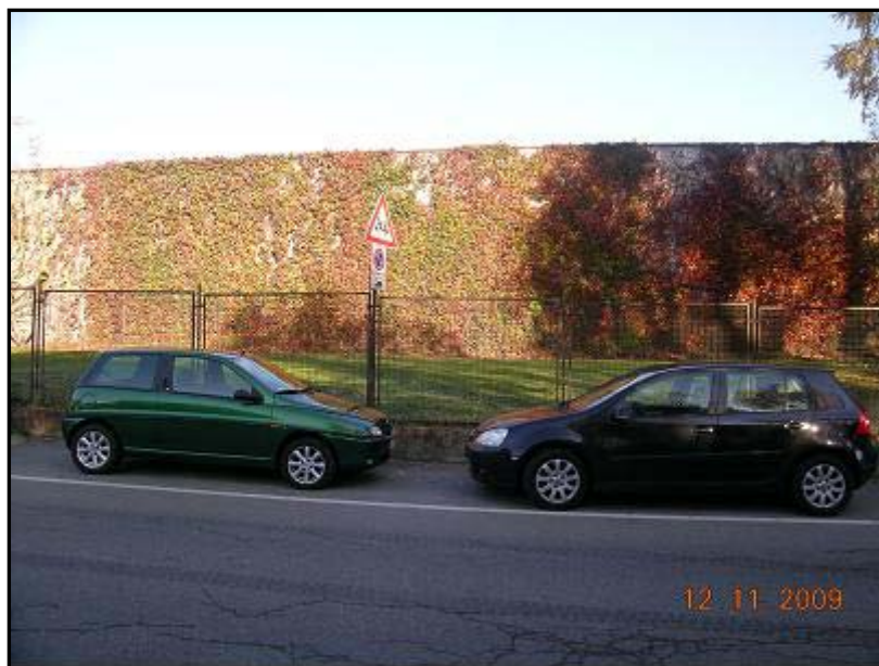
Figura 11 Via 2 Giugno