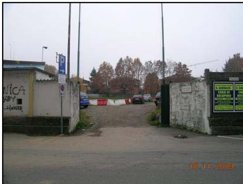
Figura 5 Via Monte Zeda - Ingresso