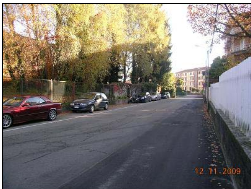
Figura 12 Via 2 Giugno