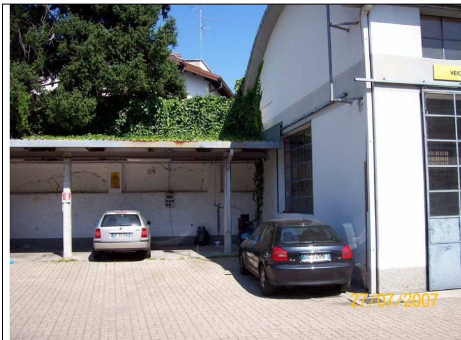
Figura 5 cortile verso manica nord