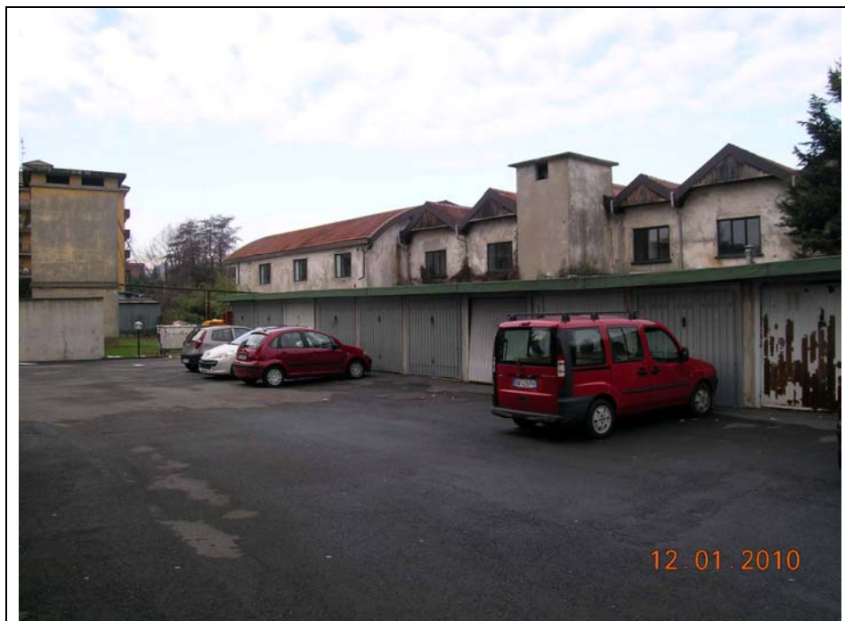
Bassi fabbricati in sponda sx