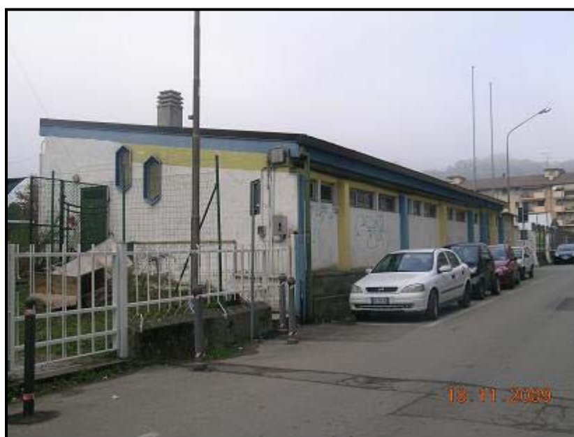
Figura 4 Via Monte Zeda