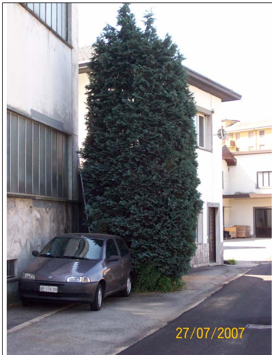
Figura 8 ingresso nord manica lungo il Vevera