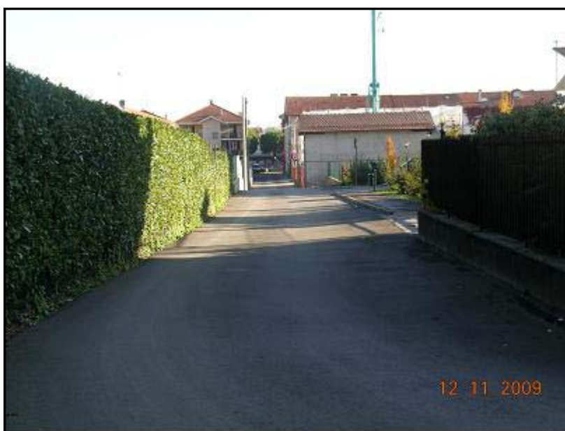
Figura 25 Via Giosuè Carducci