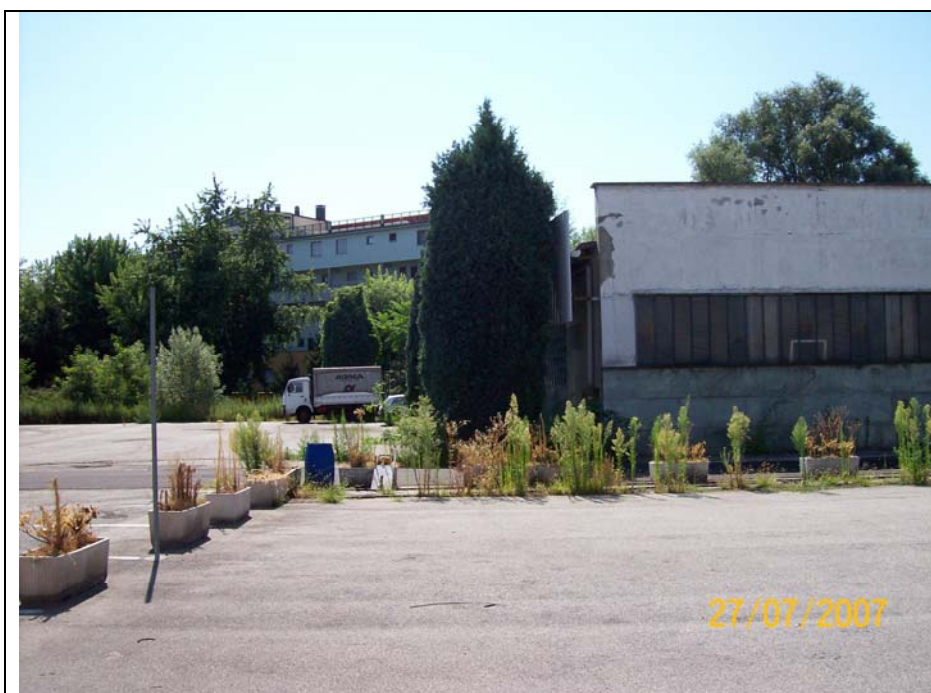
Figura 6 cortile verso Vevera