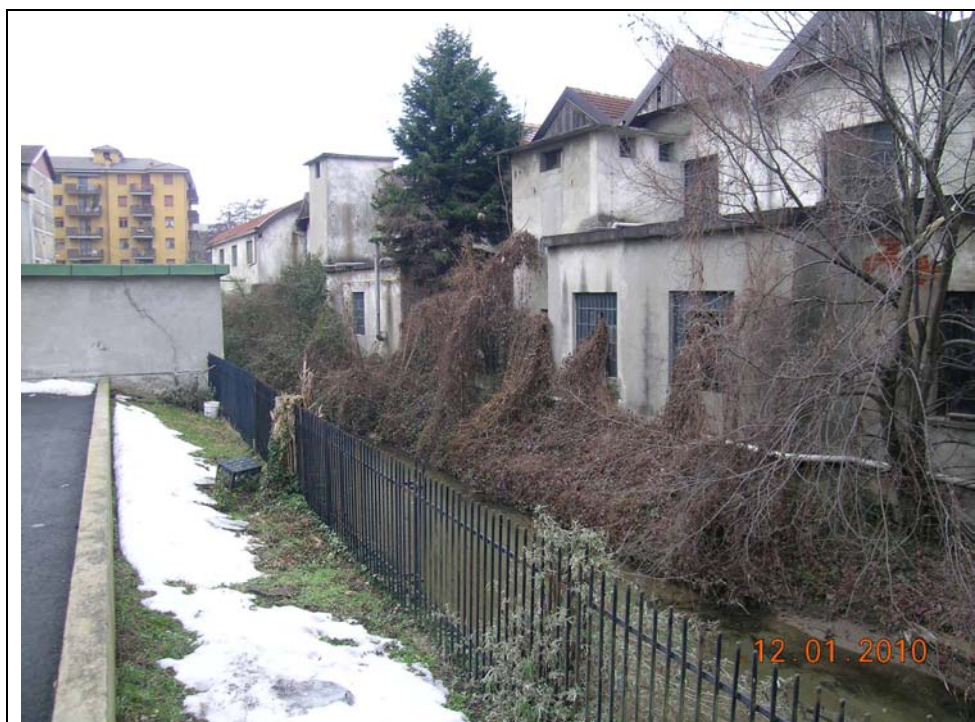
fronte verso Vevera da sponda sx verso ovest

Sequenza immagini del fronte Vevera in destra e sinistra spondale