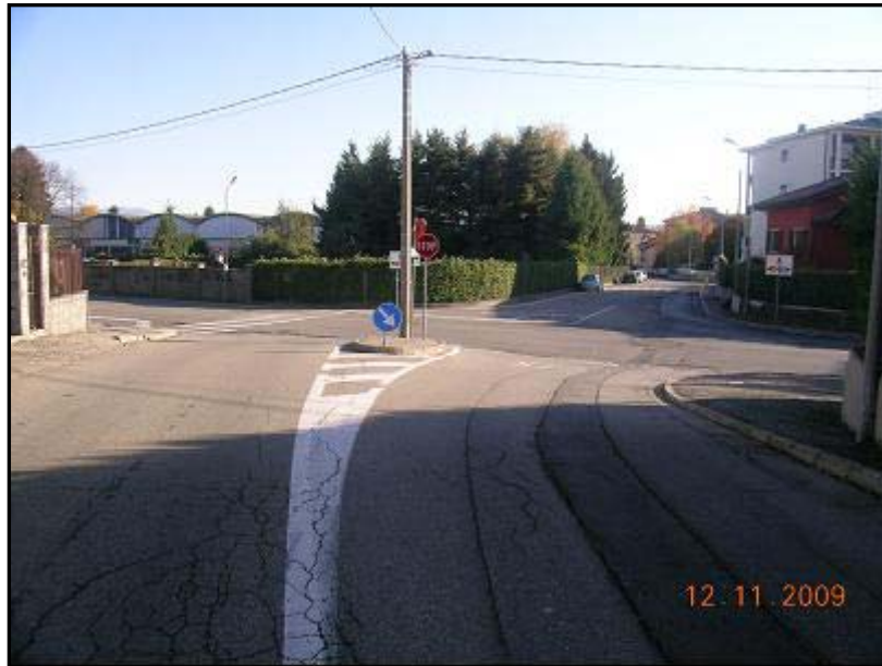
Figura 17 Via Nino Bixio