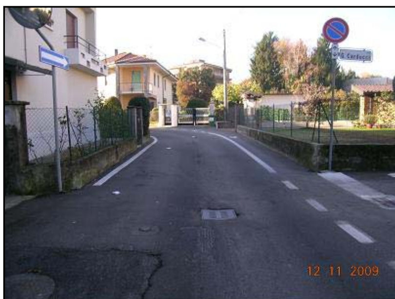
Figura 29 Via 2 Giugno