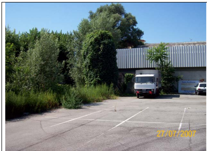
Figura 11 parcheggio verso ovest