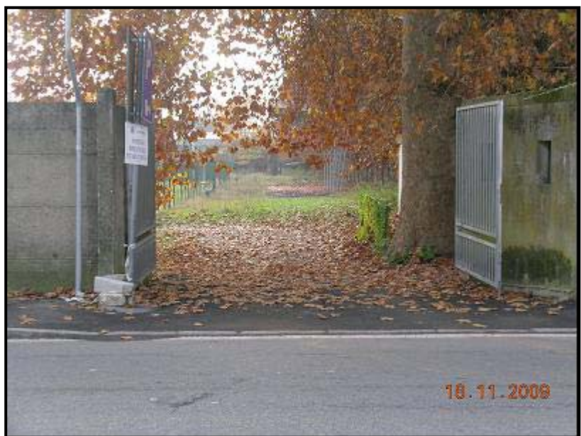
Figura 10 Via Vittorio Veneto – Ingresso avventori