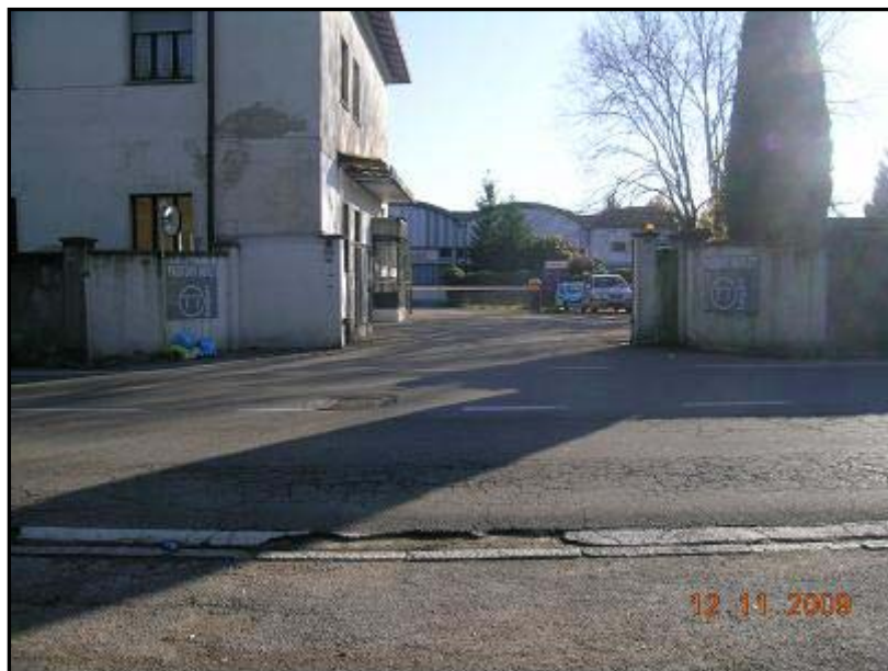
Figura 19 Via General Chinotto ingresso veicolare