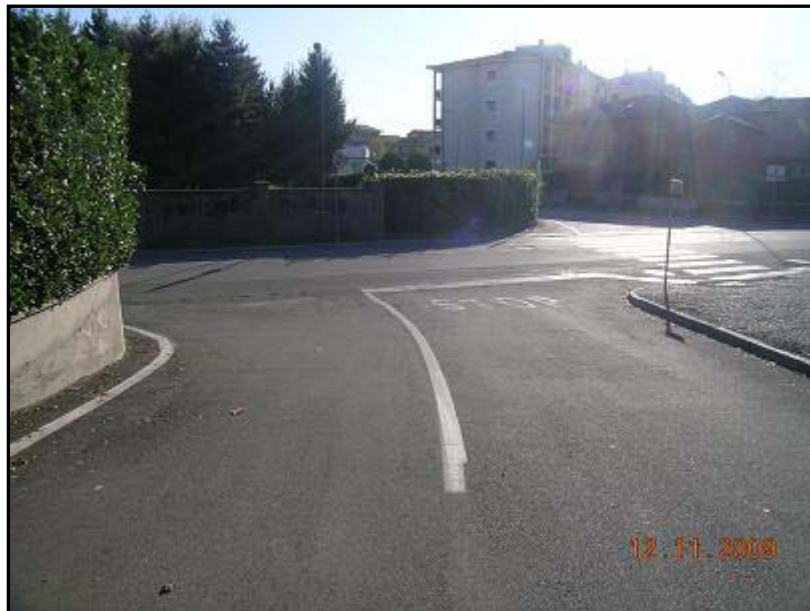
Figura 18 Via Fratelli Cairoli