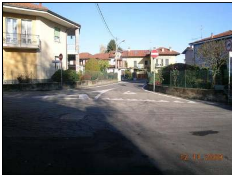
Figura 30 Via 2 Giugno