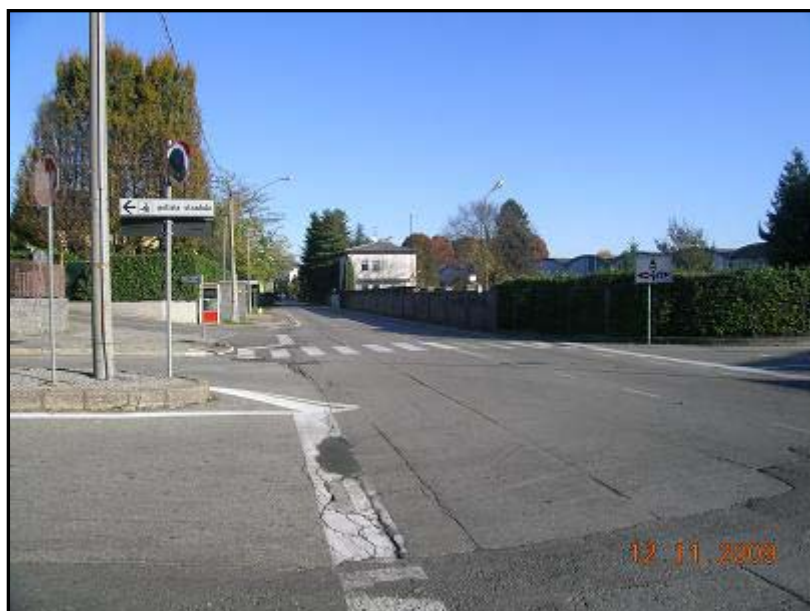
Figura 16 Via General Chinotto