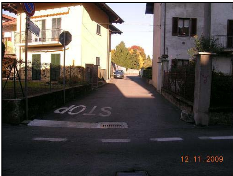
Figura 27 Via Giosuè Carducci