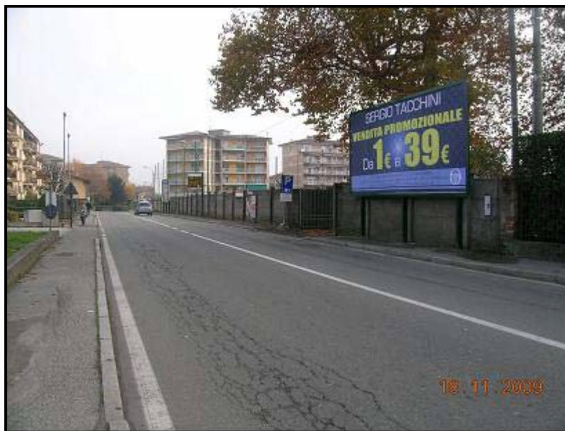
Figura 9 Via Vittorio Veneto