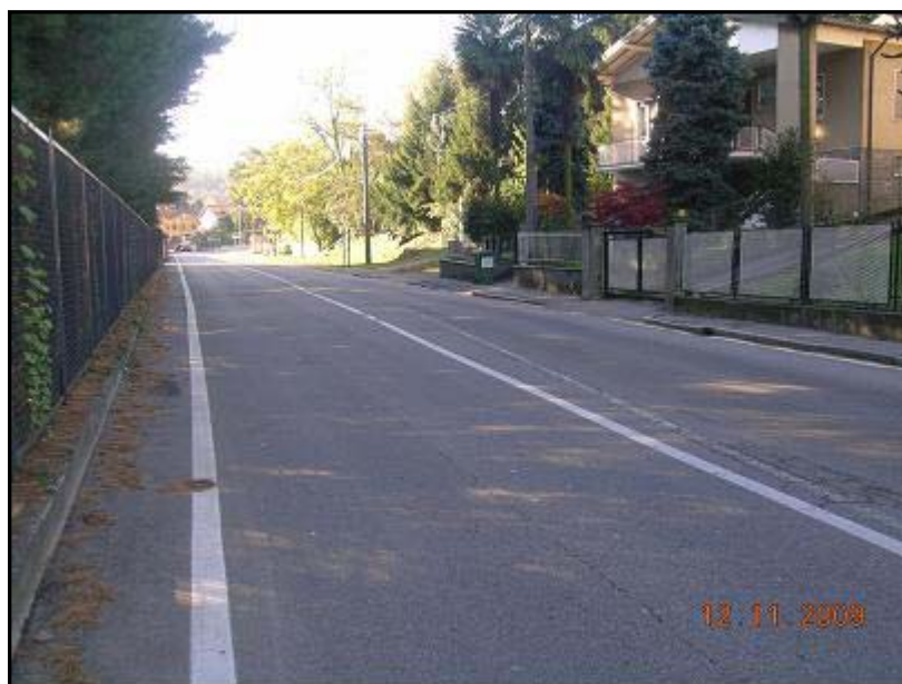
Figura 21 Via General Chinotto