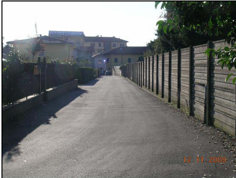
Figura 26 Via Giosuè Carducci