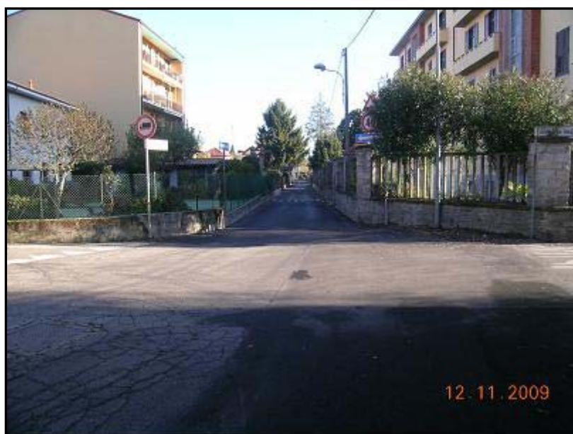
Figura 8 Via Primo Maggio