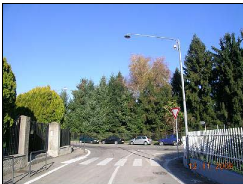
Figura 14 Via Fratelli Bandiera