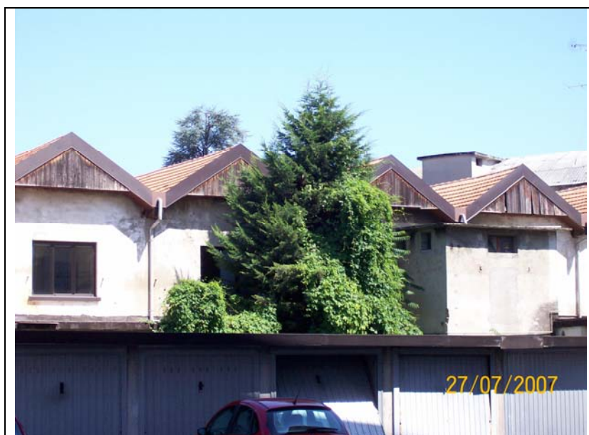
Figura 12 garage compartì 1c verso Vevera