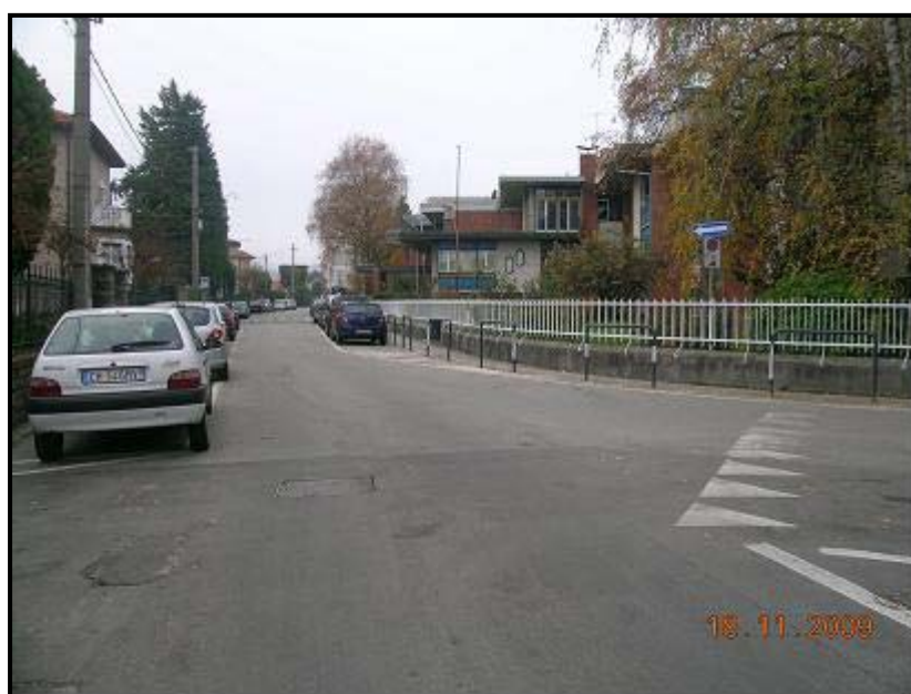
Figura 2 Via Monte Rosa