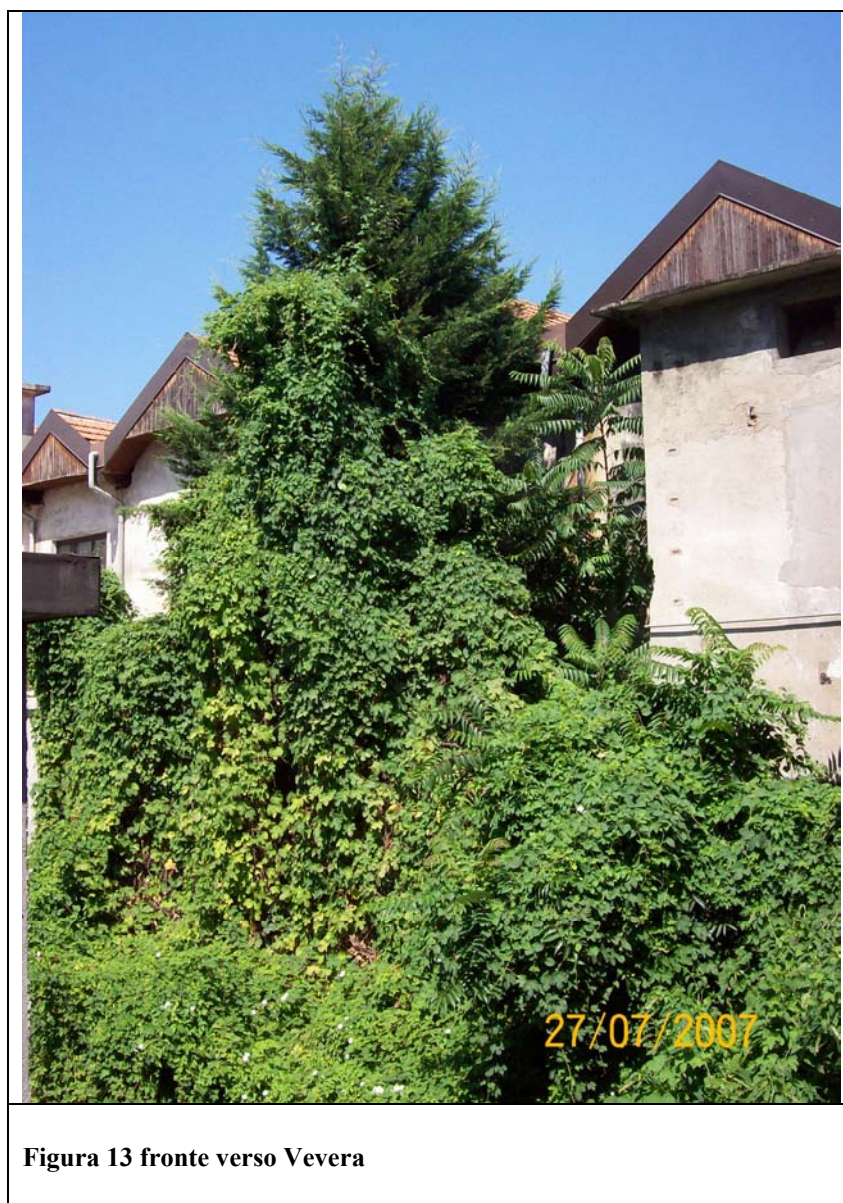
Figura 13 fronte verso Vevera