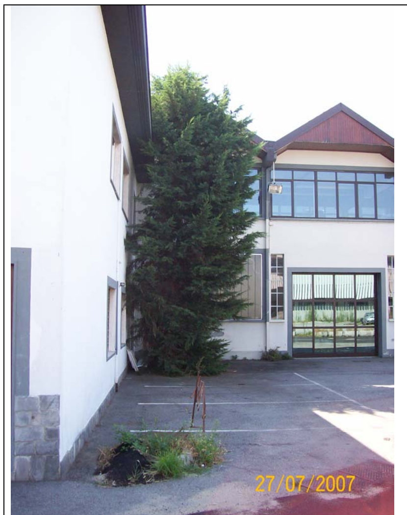
Figura 9 ingresso nord manica lungo il Vevera