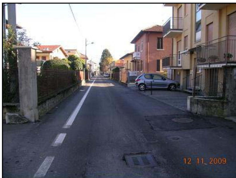
Figura 28 Via 2 Giugno