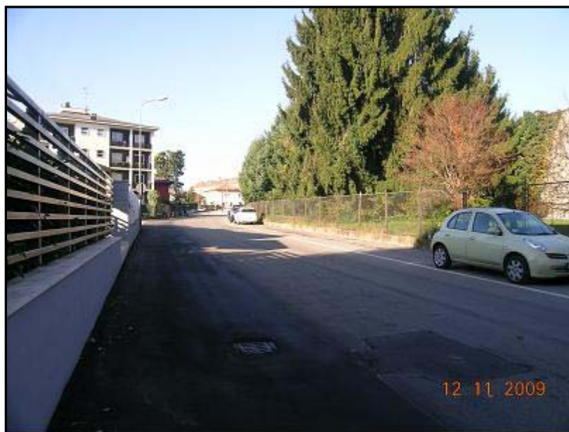
Figura 13 Via 2 Giugno