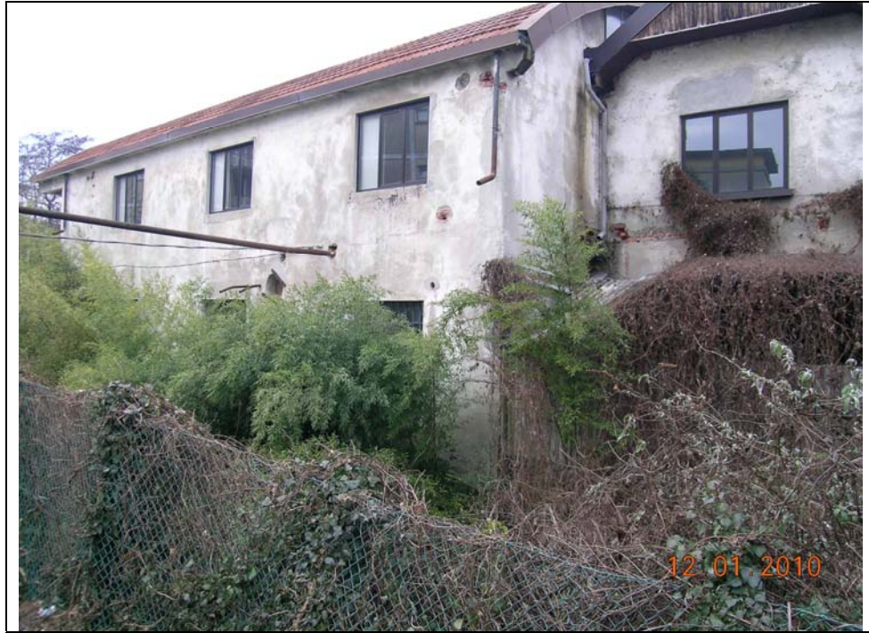
fronte verso Vevera da sponda sx verso fabbricato