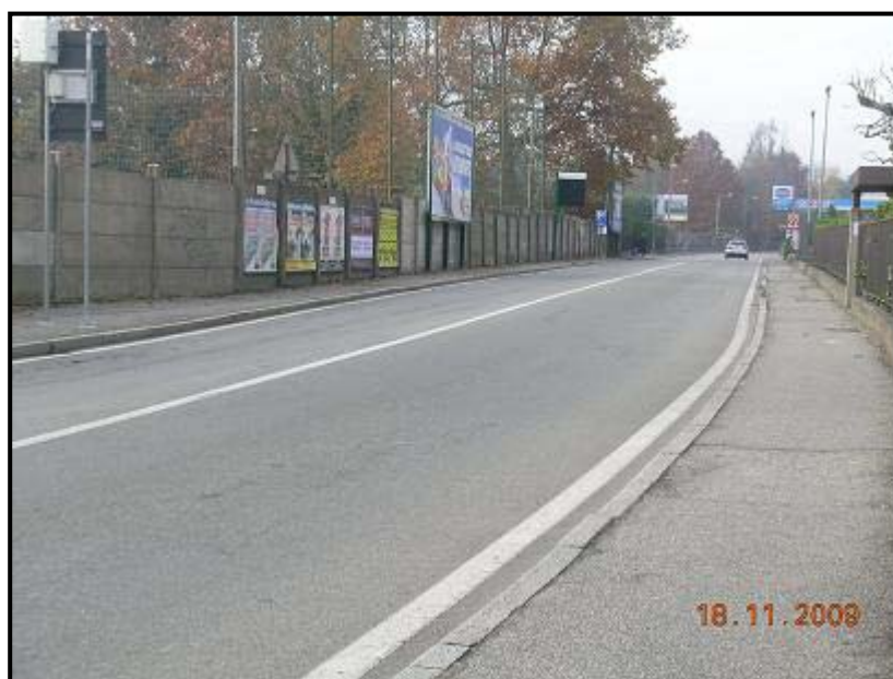
Figura 8 Via Vittorio Veneto