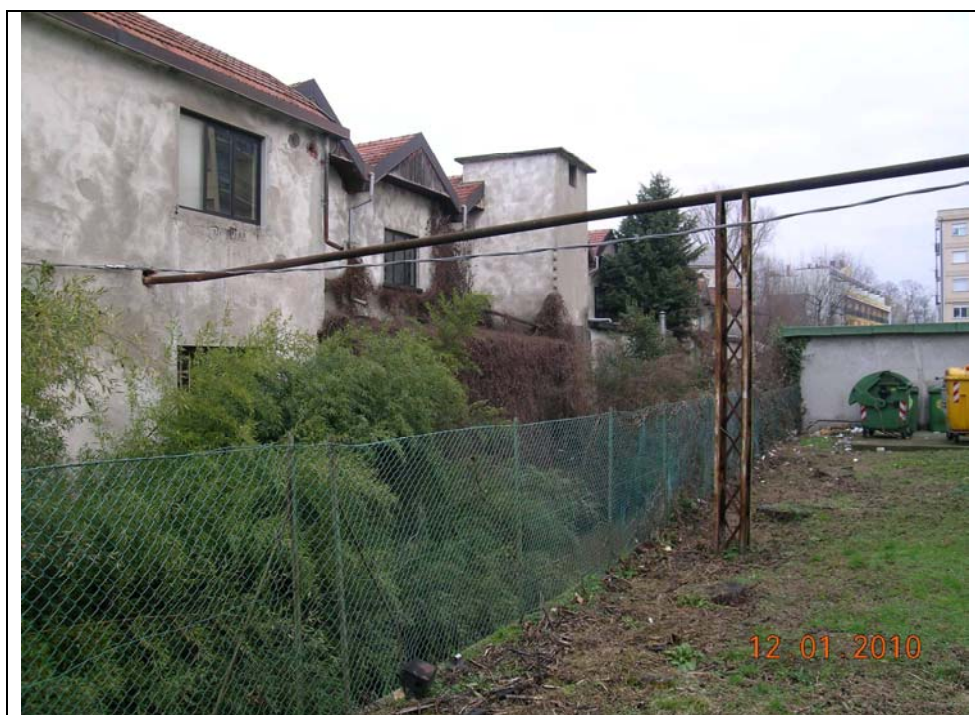
fronte verso Vevera da sponda sx verso est