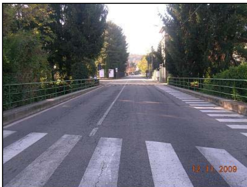
Figura 20 Via General Chinotto