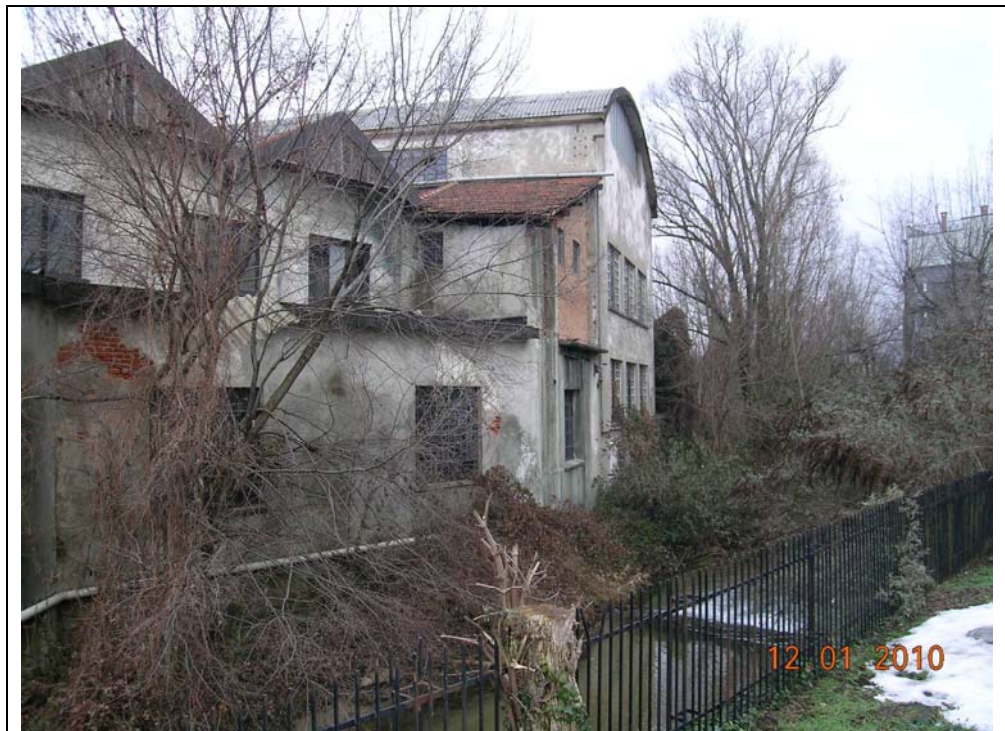
fronte verso Vevera da sponda sx verso fabbricato