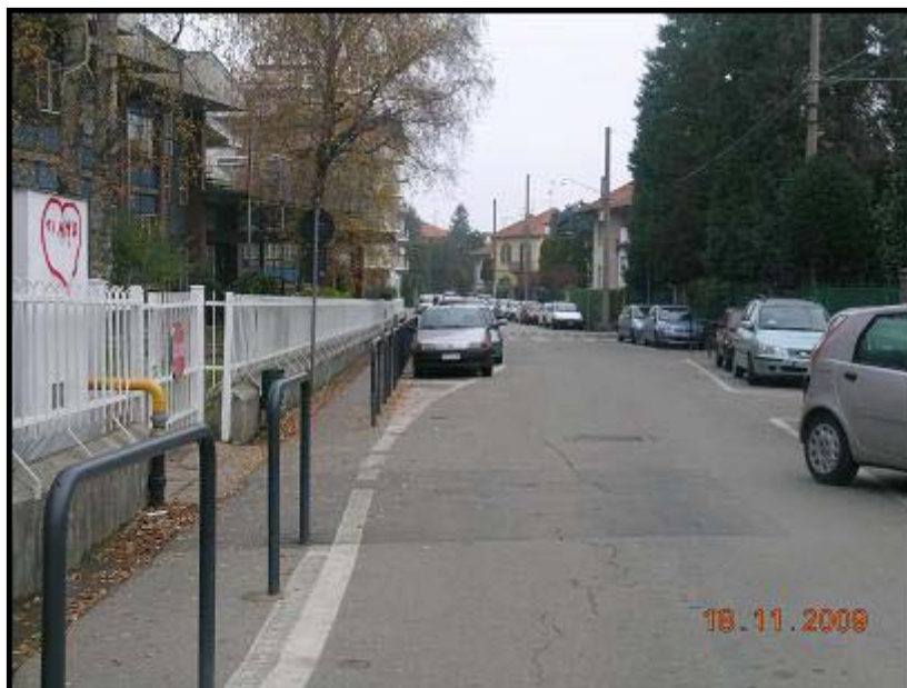
Figura 1 Via Monte Rosa