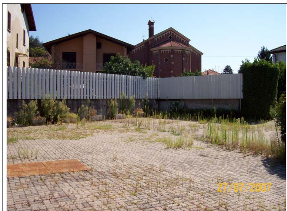
Figura 2 cortile verso est