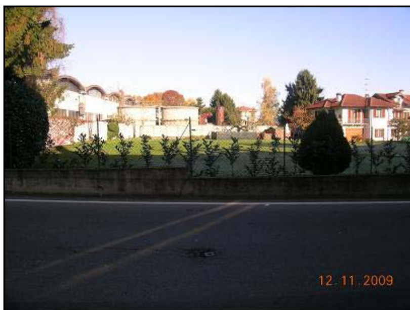
Figura 10 Via 2 Giugno