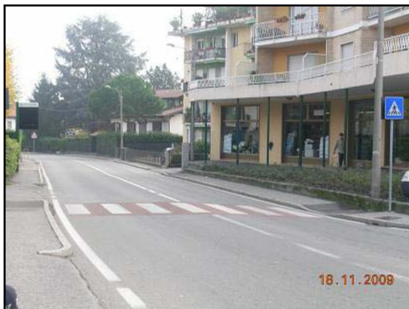
Figura 7 Via Vittorio Veneto