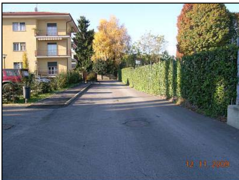
Figura 24 Via Giosuè Carducci