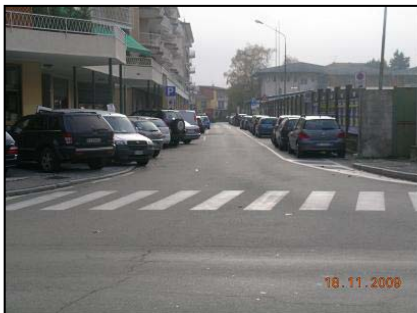
Figura 6 Via Vittorio Veneto – vista su Via Monte Zeda