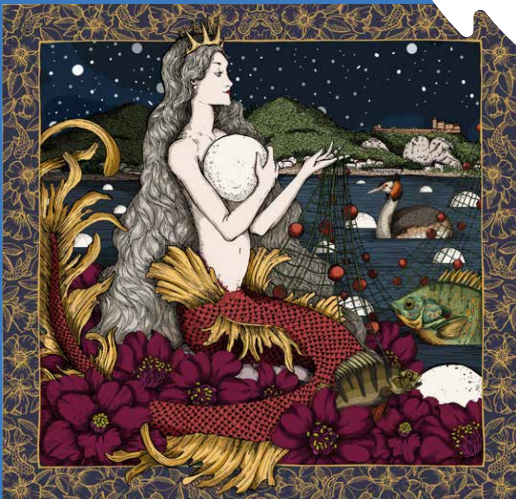
Illustrazione Andrea Tarella